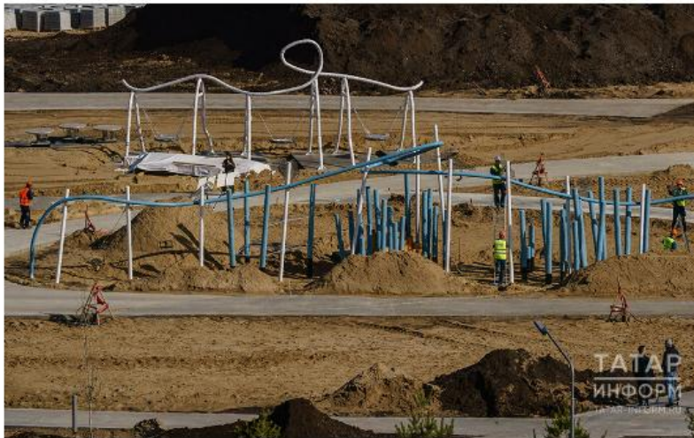
Нынешний проект станет самым большим детским парком – 3,5 га, который будет вмещать одновременно до 8 тыс. посетителей: детей, родителей, бабушек, дедушек