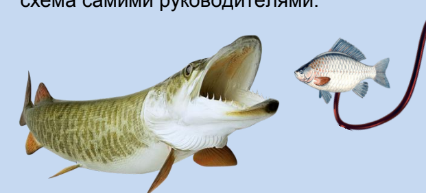
Схема «крючки» также не воспринимается многими опрошенными руководителями как коррупционная практика — речь об использовании в своих интересах рычагов воздействия на сотрудников, партнеров и ответственных лиц через сбор конфиденциальной и компрометирующей информации.

«Пингвины» — характерный для России тип коррупции. Так именуются случаи использования в коррупционных целях дружбы и прочих личных отношений. Практика найма родственников, использование поставщиков, находящихся в дружественных отношениях с руководством, говорится в исследовании, часто даже не воспринимается как коррупционная схема самими руководителями.