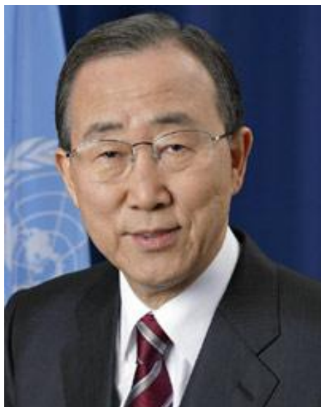
Пан Ги Мун, Генеральный секретарь ООН

Коррупция — это поражающая все страны болезнь, которая подрывает социальный прогресс и порождает неравенство и несправедливость.