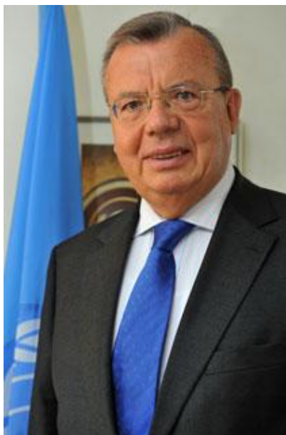
Юрий Федотов, глава Управления ООН по наркотикам и преступности

"Коррупция является вором экономического и социального развития; она ворует возможности простых людей к прогрессу и процветанию", сказал глава Управление ООН по наркотикам и преступности Юрий Федотов на открытии пятой сессии Конференции государств-участников Конвенции ООН против коррупции в Панама-Сити - COSP5.